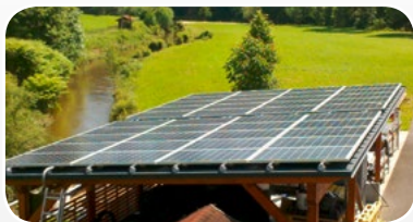
PV-Anlage KARLSTROM 10,6 kWp